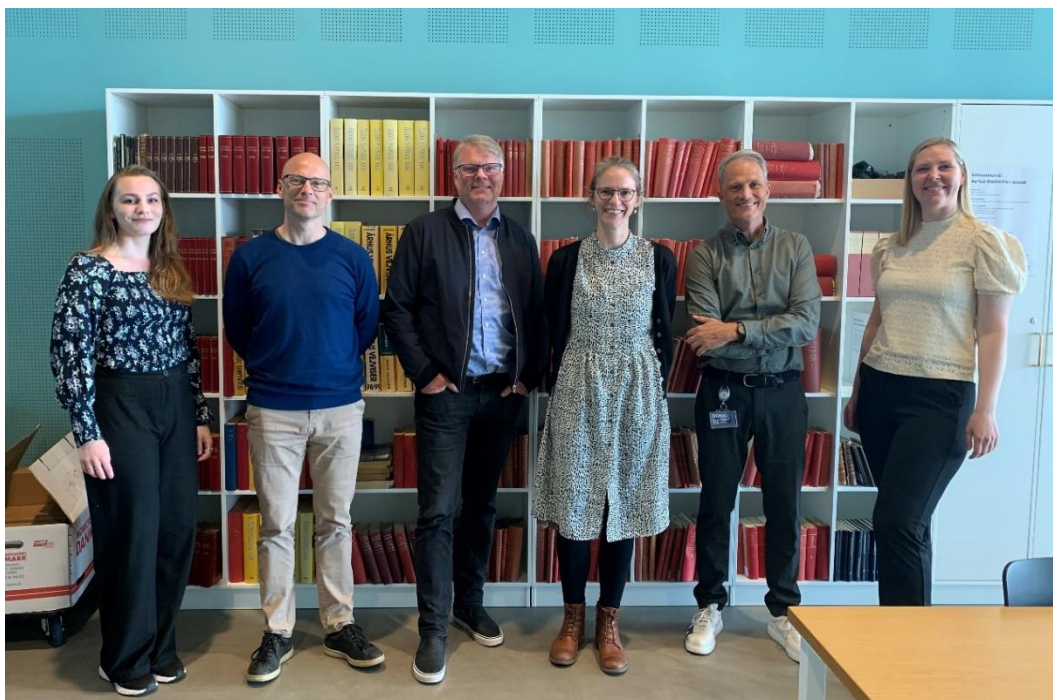
Aarhus Stadsarkiv delte mye formidlingskompetanse med oss.

Til sist så ønsker vi å sende en stor takk til Arkivforbundet for støtten til studieturen. Det var gull verdt!