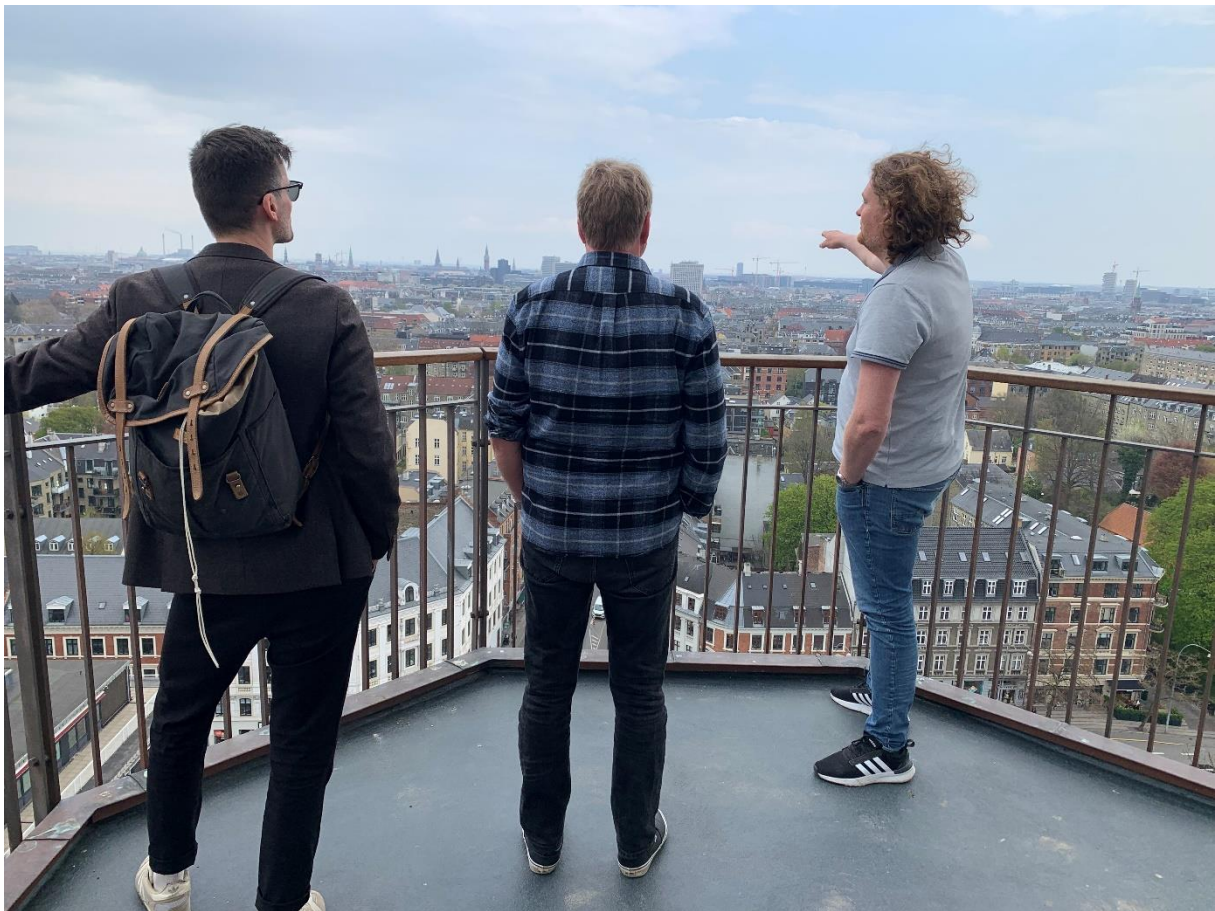
I tårnet på Rådhuset.

Etter besøket på København Stadsarkiv syklet vi til Fredriksberg Stadsarkiv. Der ble vi tatt godt imot av flere av arkivets ansatte. Vi diskuterte ulike utfordringer som kommunale arkiver står ovenfor og likheter og ulikheter mellom kommunearkiver i Norge og Danmark. Vi fortalte litt om hvordan vi jobbet med ulike formidlingsprosjekter og vi ble presentert for måter som Fredriksberg Stadsarkiv jobbet med formidling gjennom blant annet byvandring. Arkivet hadde også noen samarbeidsprosjekt, som blant annet kbhbilleder.dk som København Stadsarkiv driver.