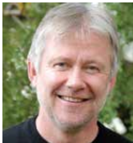
Cecilie Skog Fjellklatrer og ekspedisjonsfarer