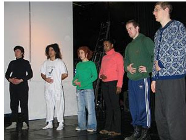
Elever ved teaterskolen på Nordic Black Theatre øver sangteknikk.

Arkivnavn: Nordic Black Theatre Arkivsignatur: A-10419 Depotinstitusjon: Oslo Byarkiv Arkivskaper(e): Nordic Black Theatre Tidsrom: 1991 - 2000 Omfang: 6 hyllemeter Klausul: Spesielle klausulbestemmelser for privat arkiv Ordning: Under ordning Katalogisering: Uten katalog eller liste Katalogmedium: Katalog bare i ASTA Lagringsmedium: Blandet Omtale av arkivet: Arkivet er på 6 hyllemeter fra 1991-2000. arkivet er under ordning. Serier: B - Kopibøker (1992 - 2000) D - Saksarkiv ordnet etter organets hovedsystem (1992 - 2000) Da - Saksarkiv (1992 - 2000)