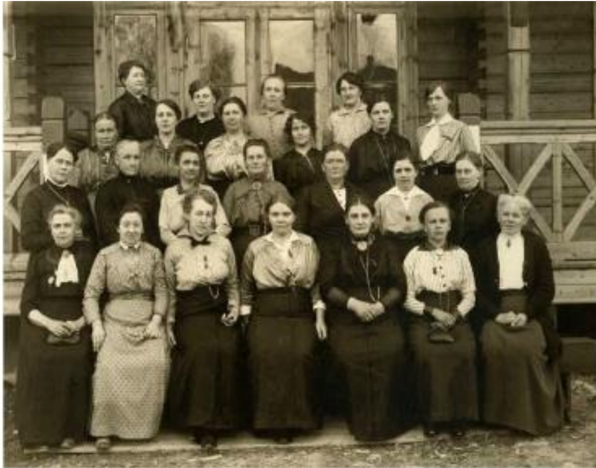
Norges Kooperative Kvinneforbunds 5. landsmøte på Lillestrøm i 1915. (NKLs arkiv, i Riksarkivet) Foto: Anna Sofsrud. Original: positiv s/h.