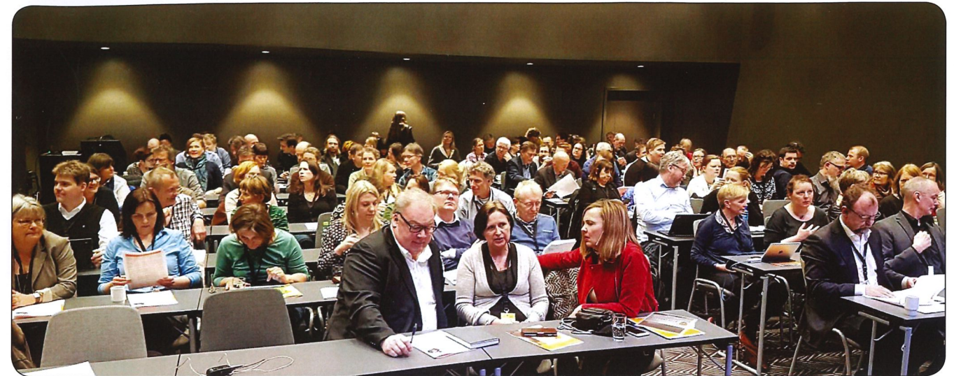
Der var 115 deltagere i den norske privatarkivkonference 4.-5. april 2017 (Arkivforbundets hjemmeside).

Helt bortset fra, at det altid er dejligt at blive opdateret om forholdene i andre landes arkivverden