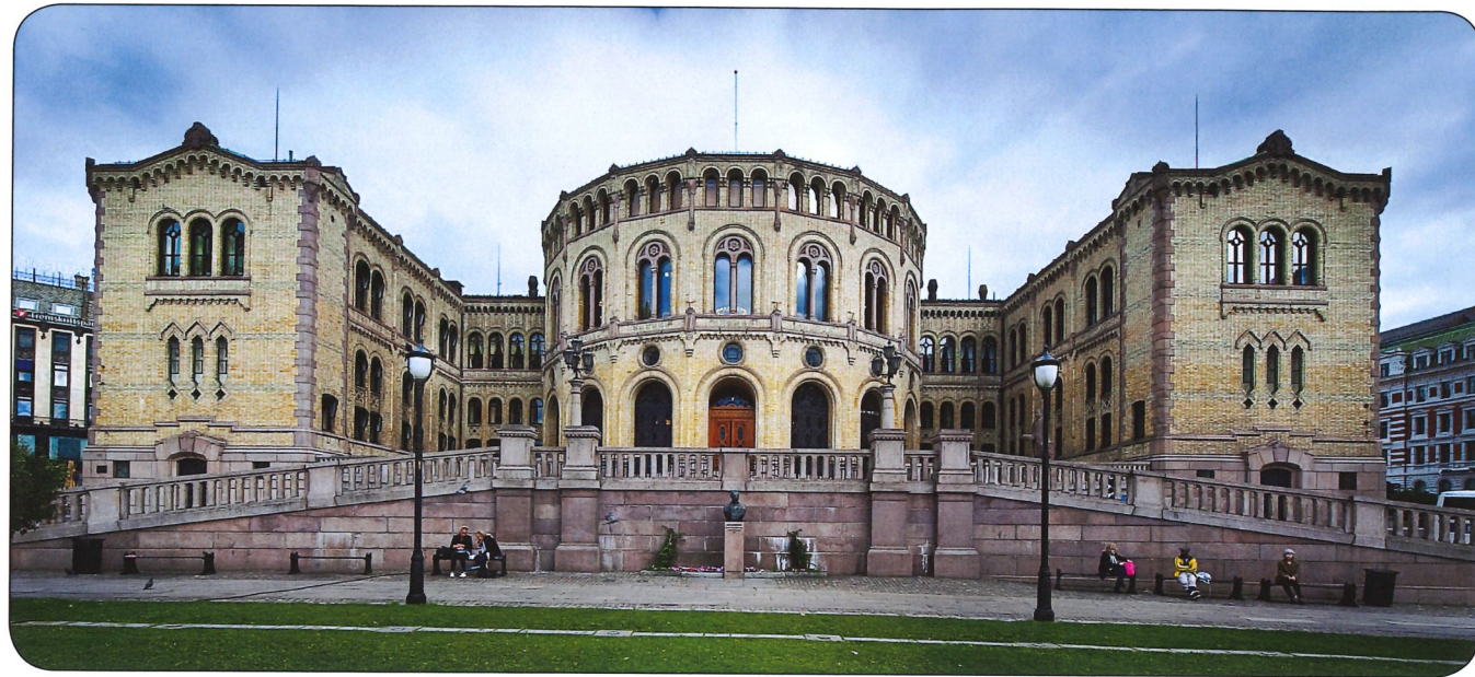
Det norske Storting, hvor der for nylig har vist sig at være flertal for en samlet norsk arkivudredning.