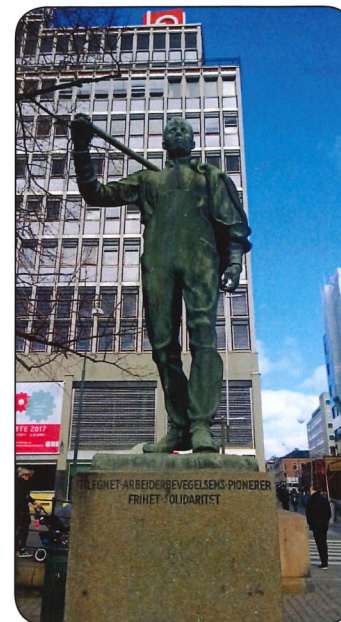
Tid til eftertanke: Statue uden for det norske LO's hovedkvarter, der måtte ombygges for et større millionbeløb efter Breiviks terrorangreb i Oslos centrum i 2011 – tæt derved er blandt andet den store regeringsbygning, der var et af de primære mål for angrebet, revet ned til grunden.

– ikke mindst når der er så mange fællesmængder mellem arkiverne, som der er med de andre skandinaviske lande – så gav privatarkivkonferencen i hvert fald mig anledning til at genoverveje vores eget arbejde i den danske lokal- og stadsarkivverden. Vi kan med stor sikkerhed lære noget af vore norske arkivkollegers arbejde med den politiske verden – for få dage siden kunne Arkivforbundet således på sin Facebookside meddele, at der var samlet et flertal i Stortinget (uden om regeringen!), som pålægger regeringen at gennemføre "en bred udredning af samfundets arkivfunktioner, med særlig vægt på regionale arkivtjenester, nationalt samspil og håndtering af digitale udfordringer". Sådan en generel arkivudredning – og en efterfølgende bred arkivlovs-