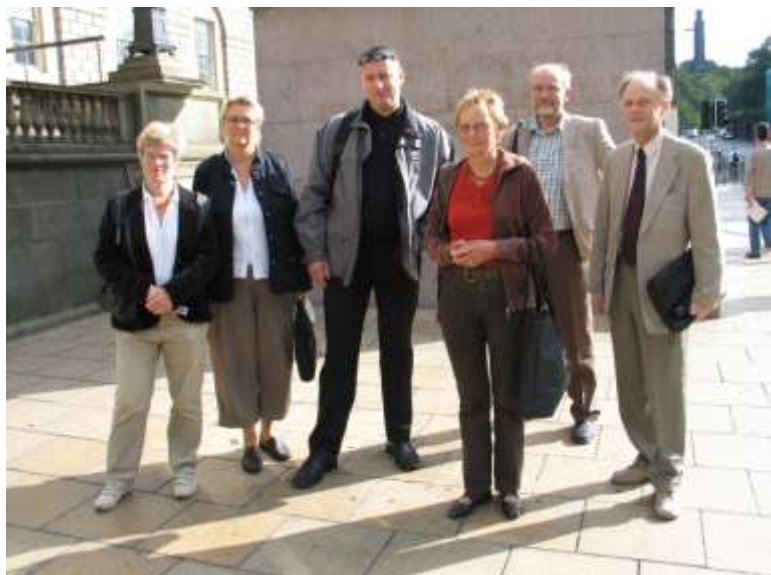
Deltakerne fra de tre arkivorganisasjonen NA, KAF og LLP var på studietur til Skotland for å få høre om hvordan arkivorganisasjonene der fungerer.

I min lederperiode ble det lagt stor vekt på det arkivpolitiske arbeidet. LLP kom med flere høringsuttalser bl.a. om St.meld. 48 (2002 -2003) Kulturmeldingen, Nysæterutvalgets innstilling, Kulturloven og statsbudsjettene. LLP møtte Stortingets Familie og kulturkomité og Kirke- og kulturdepartementet. Kravet om støtteordninger for privatarkiver og en arkivutredning ble fremmet ved flere anledninger.