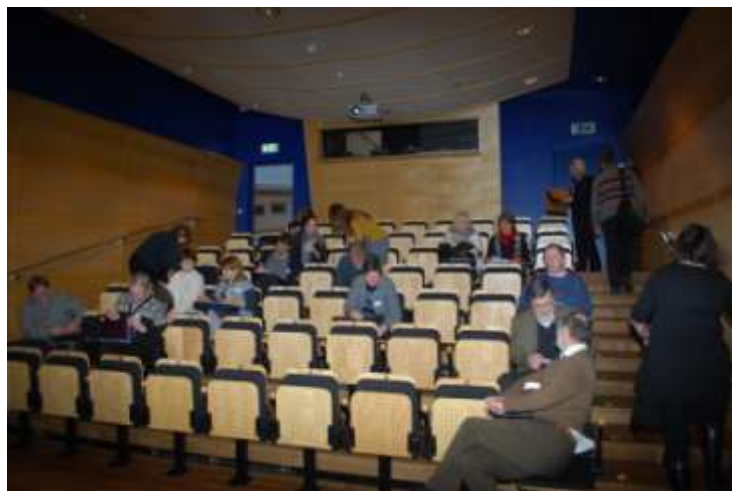
Noen av kursdeltakerne på kurset "Privatarkivarbeid i museene"