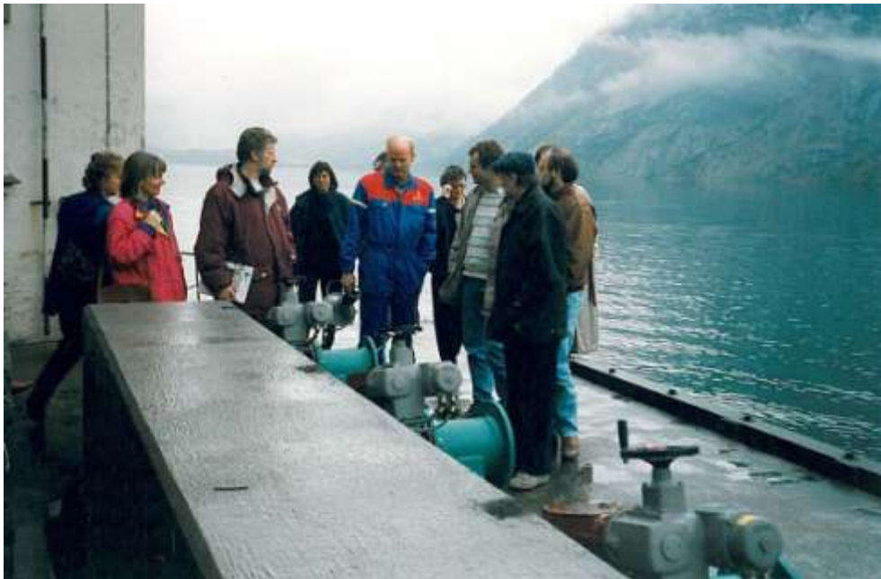
Fra en utflukt under LLPs møte i Mo i Rana.

Asta prosjektet ble i 1995 fulgt opp med informasjon og markedsføring, og det ble holdt tre Asta kurs for LLPs medlemmer med til sammen 58 deltagere. Dette medvirket til at Asta var tatt i bruk i 40 institusjoner, derav 30 av LLPs medlemsinstitusjoner, allerede i stiftelsens første år.