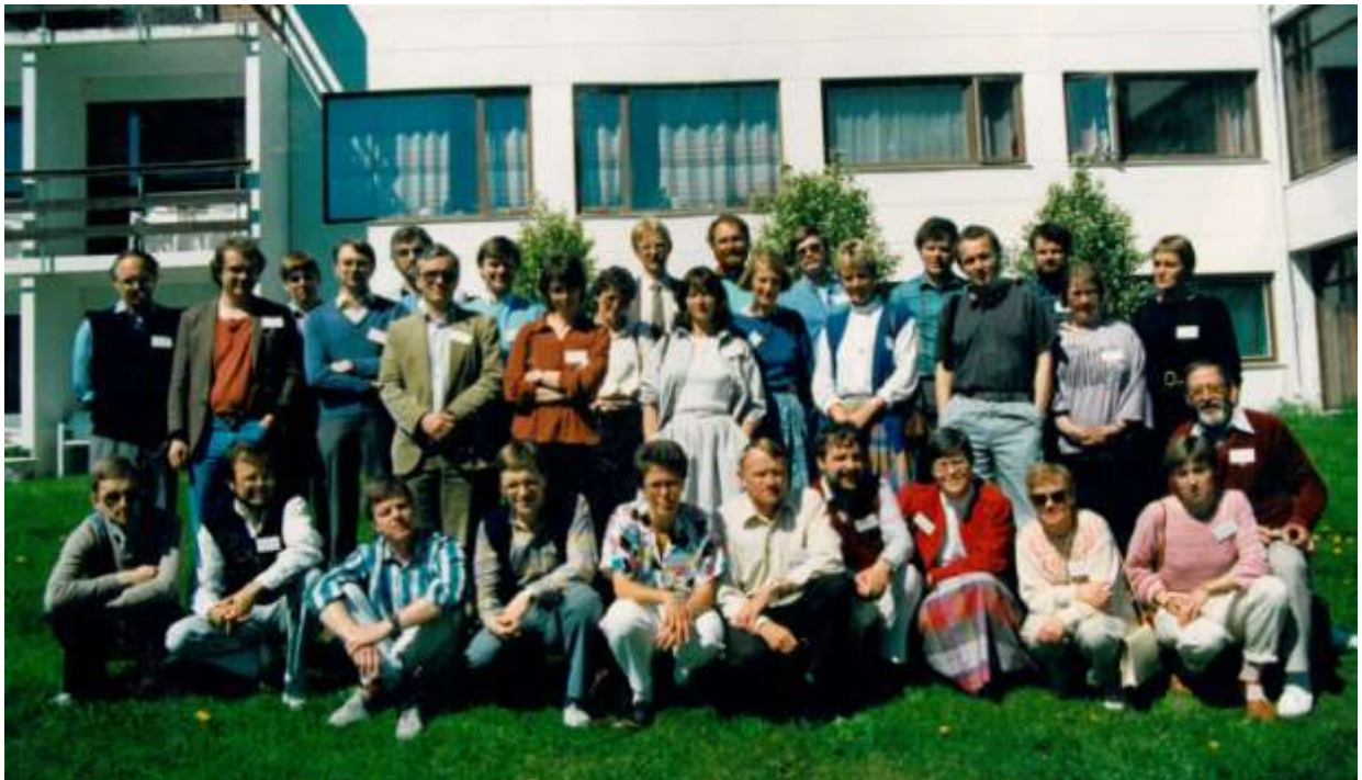
Deltakerne på LLPs første ordinære landsmøte i 1987. Landsmøtet ble arrangert i Sogndal med Fylkesarkivet i Sogn og Fjordane som vertsskap.

Inspirert samvær på arkivfaglig grunnlag preget virksomheten de første åra. Seminarer og ekskursjoner, besøk hos vennskapsforeninger i Danmark og Sverige, førte oss sammen. Dette la et godt grunnlag for et mer målrettet og langsiktig arbeid: en samkatalog, basert på ny, elektronisk teknologi, men også for faglig skoling. Vi var bevisste at lagets ressurser var små, og følgende setning var viktig å få med i den første arbeidsplanen: "Styrets arbeid er frivillig og ulønnet, og i dette ligger det åpenbare begrensninger i forhold til arbeidsoppgavene." Samtidig forventet vi på sikt offentlig støtte til arbeidet vi hadde startet. Allerede i 1987 kunne vi glede oss over at Kulturrådet støttet driften av det nye laget med 15 tusen kroner. Vi var på veg.