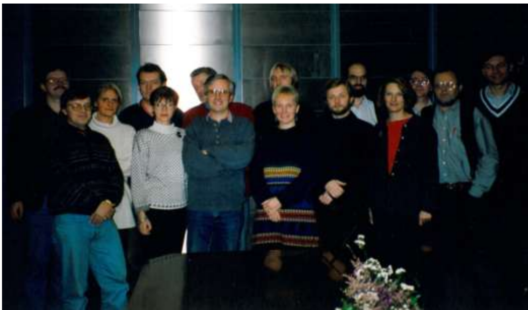
Fylkeskontaktmøtet i 1992 i Oslo.

Etter en for øvrig svært positiv høringsrunde uttalte Riksarkivet at med noen tilpasninger kunne dette også brukes på statlige arkiver. Vi gikk en runde for å få med oss disse endringene, det tok ett år, og det var et vel anvendt år. Det skaffet oss ett felles program og ansatser til felles metode i arkivarbeidet. Jeg er glad for å kunne si at en del av de elementene jeg brakte inn i dette hopehavet utfra erfaringer ved Bergen Byarkiv er blitt bestanddeler i programmet: Aksesjons- og tilvekst-modulen, allment arkivskjema, prinsipper for kategoribruk, med mer. Vi endte ut med et ferdig program i 1994.